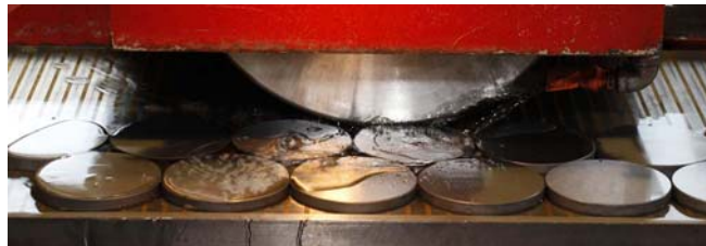
Erzeugung des Oberflächen-Finish von Härtevergleichsplatten.

Sie sind kreisrund und aus einem speziellen legierten Stahl, haben 115 mm Durchmesser, eine zumeist glänzend polierte Prüfseite sowie 12 oder 16 mm Scheibendicke und bringen ein stattliches Kilogramm auf die Waage. Das neue Produkt der Firma Siegener Werkzeug- und Härtetechnik GmbH, kurz „SWF“, in Siegen sind sog. Härtevergleichsplatten. Diese genormten und kalibrierten Prüfmittel werden im zukunftssträchtigen Qualitätswesen eingesetzt, um Messgeräte zu eichen. Erst dann können Stahlteile auf bestimmte Qua-